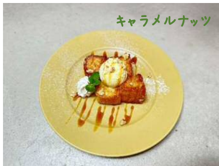
キャラメルナッツ